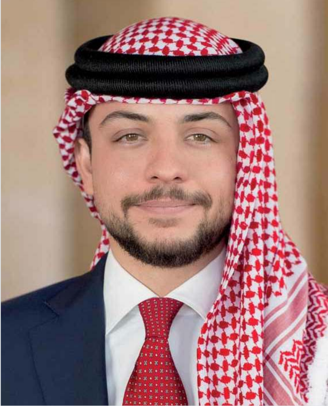
صاحب السمو الملكي ولي العهد الأمير حسين بن عبدالله الثاني