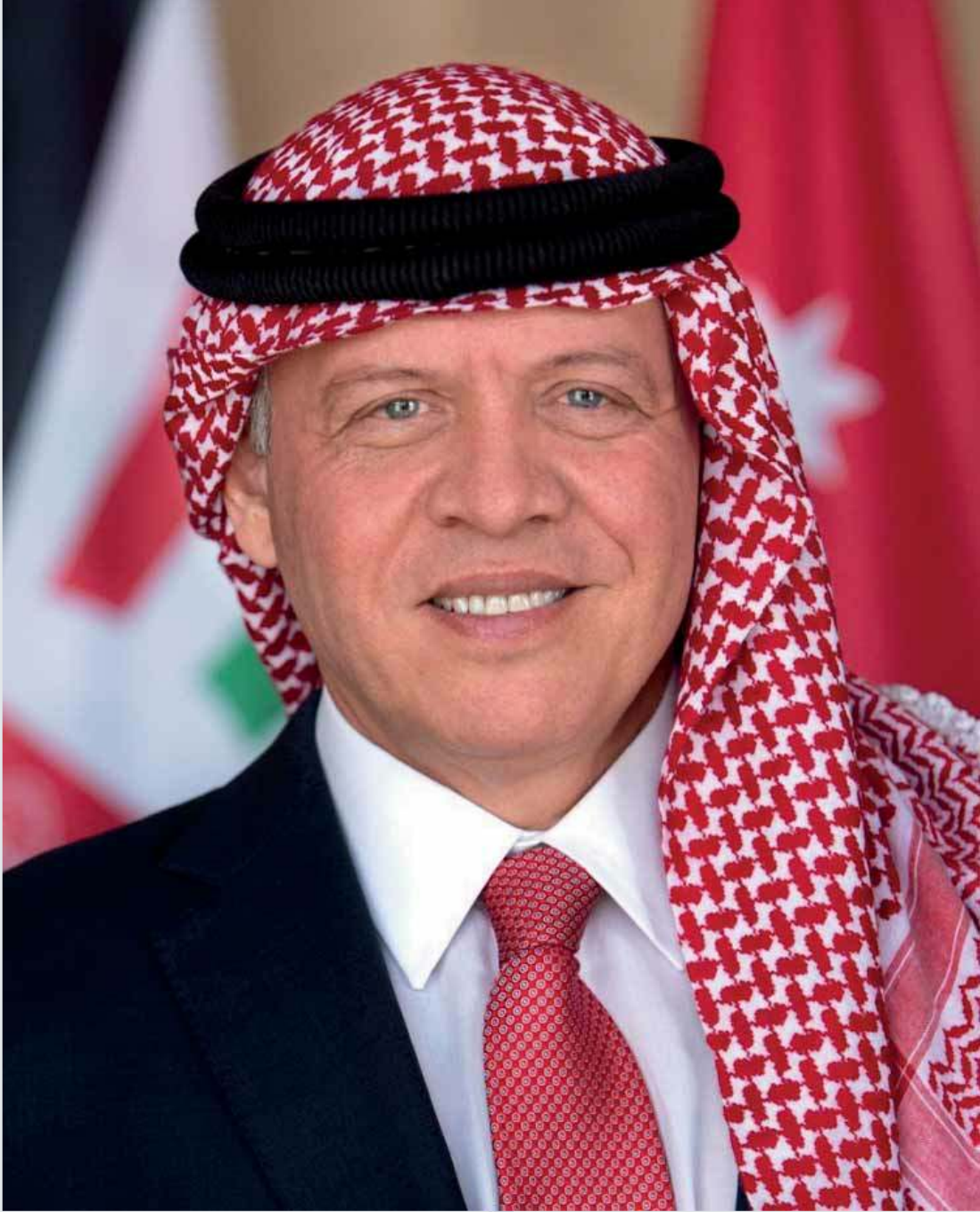
حضرة صاحب الجلالة الملك عبد الله الثاني ابن الحسين المعظم